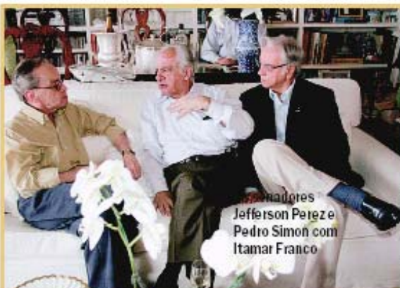
Convidados Jefferson Perez e Pedro Simon com Itamar Franco